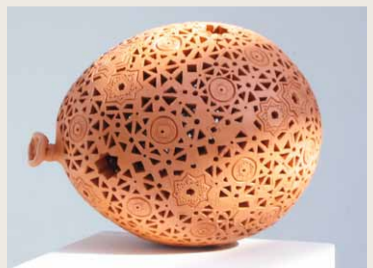
Sans titre, (ballon de baudruche), céramique (grès), 35 cm, 2006