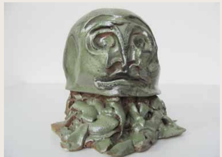
Sans titre (tête verte), céramique, 2009

En tout cas pour moi c'est sans schizophrénie, ces deux méthodes de travail font partie d'un tout qui se tient et forme un équilibre.